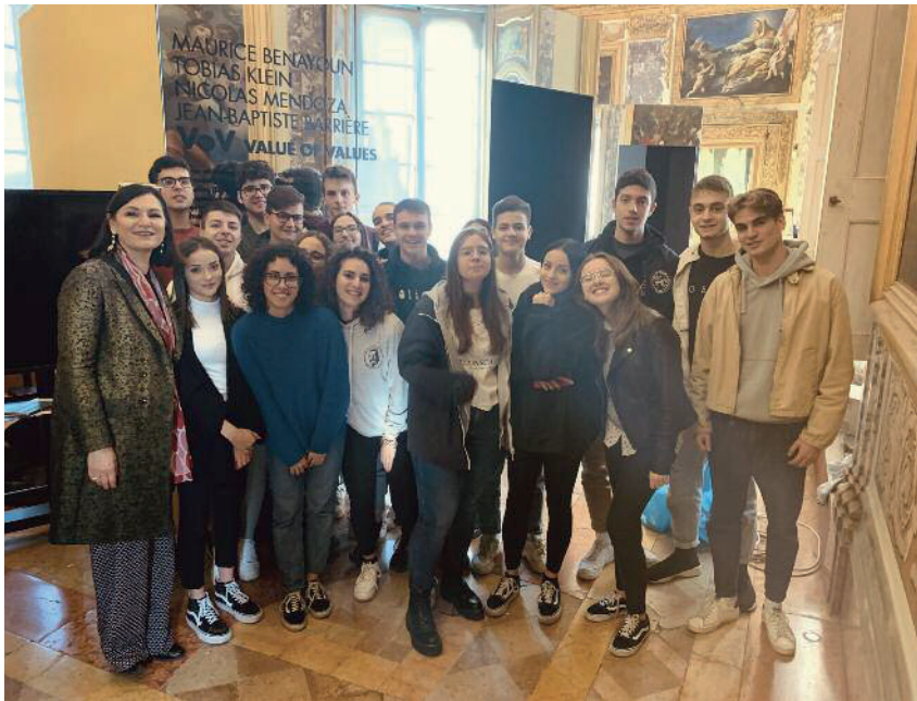
Mostra Bauhaus100, Palazzo Buonaccorsi, Macerata.

bine, esperienza educativa, conoscenza, piacere, condivisione, così come nelle aspettative della nuova definizione dell'ICOM. Il rapporto scuola-museo nel corso degli ultimi anni si è arricchito di tante esperienze innovative. I servizi educativi dei gestori museali, sia pubblici che privati, hanno qualificato negli anni l'offerta anche grazie a una riflessione sul ruolo educativo del museo che ha portato a formare personale esperto e progettualità innovative. Tuttavia, non sempre e non ovunque è così, viste le limitate risorse a disposizione dei piccoli e medi musei che raramente possono investire su questo aspetto oltre alle necessarie attività di cura delle collezioni. Inoltre, l'offerta educativa è indirizzata per lo più verso le scuole primarie e secondarie di primo grado, trascurando le progettualità per le scuole di secondo grado, spesso limitate alle sole visite guidate. Ma il punto nevralgico di questo complicato rapporto scuole-museo è senza dubbio l'ingresso e i servizi a pagamento, una necessità per la sostenibilità economica delle imprese che gestiscono i musei, ma una forma di inaccessibilità per le scuole pubbliche. Il turismo scolastico è una risorsa per la biglietteria dei musei, e i servizi educativi museali sono un'offerta specialistica dei professionisti dei musei oltre che una voce di entrata per le imprese che gestiscono i musei. Ma, quante volte un insegnante con la sua classe nel corso degli anni scolastici pianificherà l'uscita