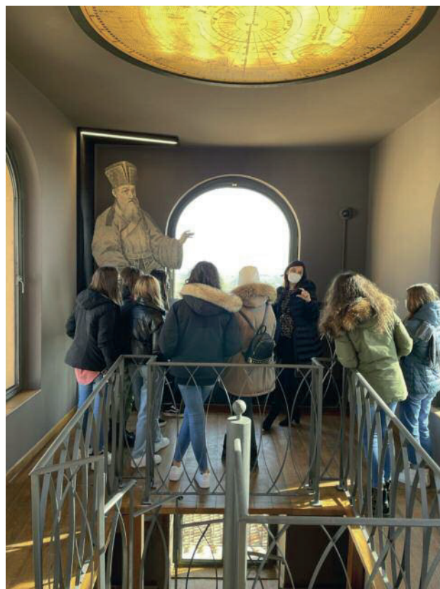
Specola Dei Mondi d'Oriente, Macerata.