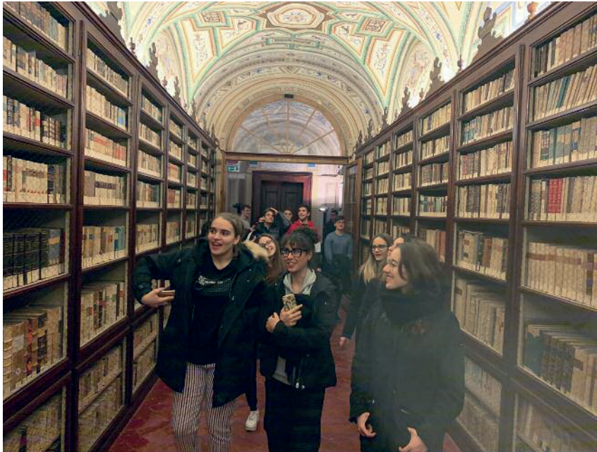
Biblioteca Mozzi Borgetti, Macerata.

Nuova è invece l'urgenza di trovare strumenti adeguati per ricollegare scuola-e-patrimonio culturale, superando le logiche del binomio scuola-&-patrimonio culturale, per adottare innovative strategie di condivisione del compito educativo, sapendo di essere tutti dentro la comune comunità educante, per crescere cittadini e cittadine attivi, liberi, desiderosi di partecipare, consapevoli dell'eredità che è stata ricevuta e su cui si può investire per la crescita.