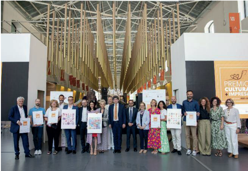
Premiati IX edizione Cultura + Impresa.

giatore Goloso, Acel Energie, Germa, Ricola, Cameo e Mastertent.