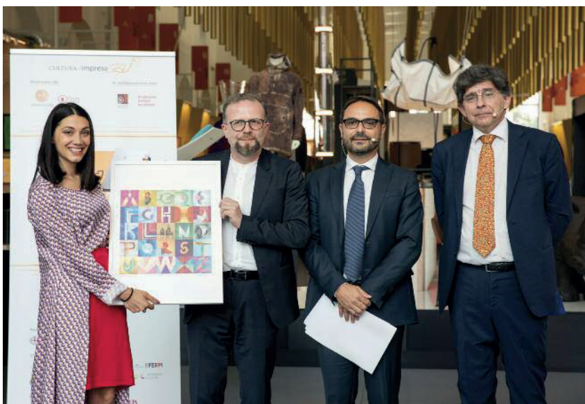
PIC - Primo Premio Produzioni Culturali d'Impresa.

Ad aggiudicarsi il Primo premio per la categoria Sponsorizzazione e Partnership Culturali è stato ‘Opere in Parole’ del Museo Accademia Carrara di Bergamo , in partnership con l’Ospedale Humanitas Gavazzeni di Bergamo: un progetto che fa dialogare cura, bellezza, salute e cultura portando l’arte del Museo Accademia Carrara nelle sale di attesa, nei corridoi, nei reparti e nella terapia intensiva dell’Ospedale Humanitas. Il Primo Premio per le Produzioni Culturali d’Impresa è stato assegnato a ‘PIC - Patrimonio Industriale Contemporaneo’ , progetto di