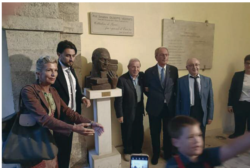
Convegno "Giuseppe Vedovato. L'etica e il dialogo per la diffusione della cultura europeista", Greci (AV), 22 agosto 2022.

Firenze fu un po' la seconda patria di Giuseppe Vedovato che lì si affacciò per la prima volta in politica nel servizio alle istituzioni come Consigliere provinciale. Deputato dal 1953, quindi Senatore fino al 1976, durante questo lungo arco di esperienza parlamentare, 23 anni, per un triennio presiedette l'Assemblea parlamentare del Consiglio d'Europa (1972- 1975), della quale dal 1988 fu Presidente Onorario.