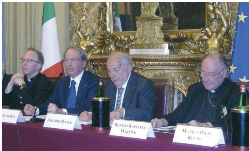
Convegno "Giuseppe Vedovato. Un Italiano per L'Europa" Roma 27 marzo 2014.

centro quello di Giuseppe Vedovato. Quest'ultimo fu collocato molti anni fa nei pressi dell'ingresso dell'emiciclo di Strasburgo ove si riunisce il Consiglio d'Europa. Quell'aula Vedovato l'ha frequentata sino alla fine dei suoi giorni com'è consentito agli ex Presidenti. Non soltanto per questa ragione egli era sempre aggiornato sull'evoluzione del dibattito a livello sovranazionale (sottolineo che sono quarantasei i Paesi Membri del Consiglio d'Europa, dei quali 27 rientrano nell'Unione Europea), ma anche perché avendo attraversato nel suo lungo servizio alle Istituzioni e alla Politica gli Enti locali, entrambi i rami del Parlamento italiano, poi il Consiglio d'Europa fino ad occuparne il più alto scranno, aveva stabilito un robusto sistema di relazioni che gli consentiva un puntuale e costante accesso alle informazioni che spesso solleva poi trasferire agli Istituti culturali e alle realtà locali che frequentava e aveva a cuore.