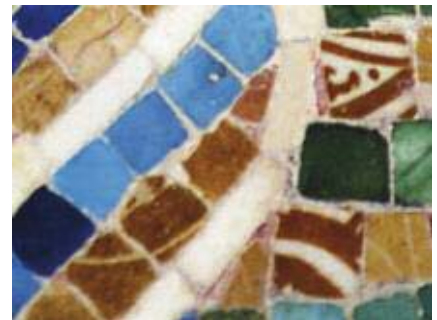
Ravello. Quelques tesselles de céramique glaçurée à décor de lustre métallique (marron) d'une mosaïque représentant le prophète Jonas issues de céramiques ramenées à Ravello par un navire ayant transporté des Croisés. Ambon Rogadeo de la cathédrale (duomo), entre 1094 et 1150 ap. J.C..