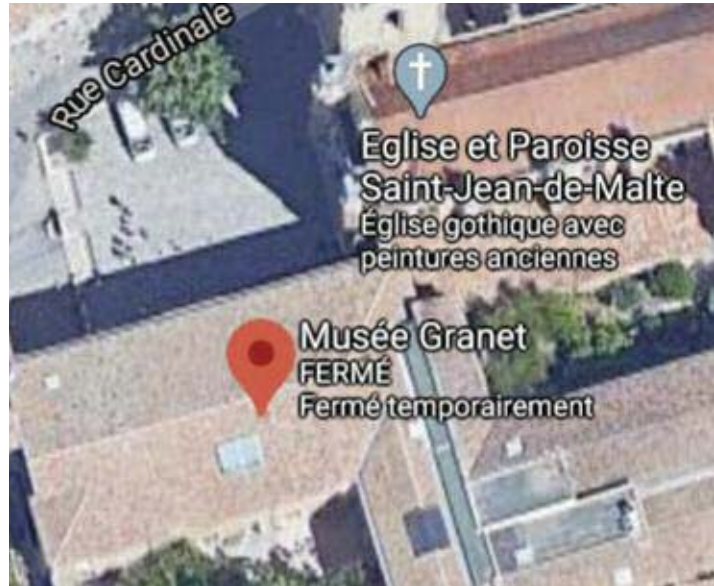
Google Earth a réagi sans tarder.