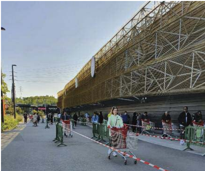
La queue devant les grandes surfaces pour cause du COVID-19.

Je pense que le Centre Universitaire Européens pour les Biens Culturels de Ravello devrait demander à tous ses membres Enseignants, Chercheurs, Artistes et Etudiants de recueillir les initiatives à caractère culturels prises à l'occasion des périodes de confinement pour mettre en évidence comment les citoyens des différents pays Européens et non Européens utilisent la «Culture» pour surmonter la crise du corona virus. Cette initiative pourrait alors faire l'objet d'une manifestation internationale pour laquelle serait demandé l'appui des Instances Européennes: Commission Européenne, Conseil de l'Europe, et Internationales: UNESCO et OMS.