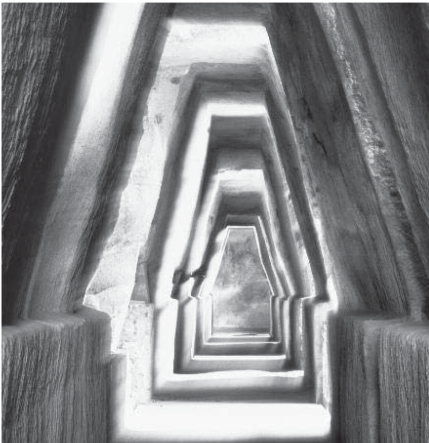
Antro della Sibilla, Cuma 1993.