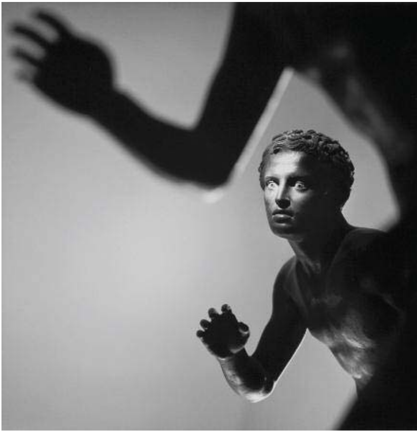
Atleti dalla Villa dei Papiri, 1986. © MIMMO JODICE.