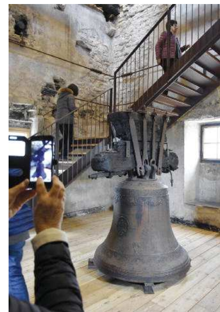
Torre Civica: visita guidata ai restauri conservativi degli effetti dell'incendio del 2015 (edizione 2019, "I tesori di Piazza Duomo")

sempre con l'ausilio di esperti storici dell'arte chiamati a declinare il tema dell'edizione di ogni anno, talvolta anche in abitazioni private o uffici.