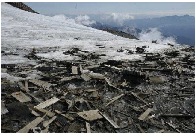
A sinistra: Fig. 7. Panoramica del Gruppo Orles-Cevedale uno dei teatri dei combattimenti della Grande Guerra.