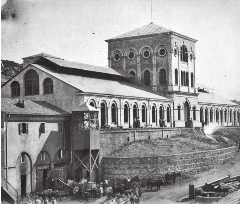
Foto storica del prospetto esterno del fabbricato del pozzo Sella.

per la comunità interessata e per le aree minerarie dismesse in quanto risponde pienamente all'esigenza di creare nuove opportunità di sviluppo e di lavoro generate proprio dal recupero e riutilizzo dell'immenso patrimonio di archeologia industriale disponibile e ancora in gran parte abbandonato.