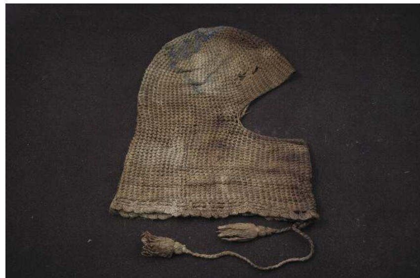
Figg. 5-6. Elementi di vestiario indossati dai due soldati italiani: scarponi chiodati e passamontagna di produzione domestica