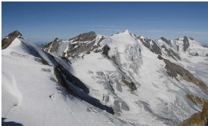
Fig. 9 Percorsi d'alta montagna proposti nell'ambito del progetto di recupero dei siti d'alta quota.