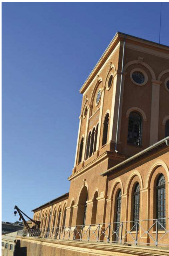
Foto recente del prospetto esterno del fabbricato del pozzo Sella.

Attraverso una bella scala a chiocciola in ghisa si accede al piano superiore del corpo centrale dove si trovava la falegnameria della miniera. Il fabbricato del Pozzo Sella, che complessivamente è costituito da una superficie coperta di circa 1500 mq, è stato interessato negli anni 2005-2011 da un profondo intervento di restauro conservativo che ne ha salvaguardato la struttura restituendo ai prospetti esterni la loro straordinaria bellezza architettonica.