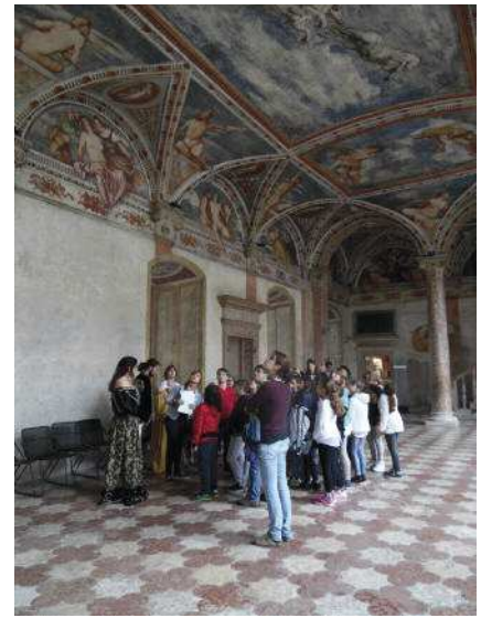
Speciale scuole: studenti ciceroni presso il Castello del Buonconsiglio di Trento.