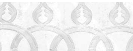
Baia Terme.