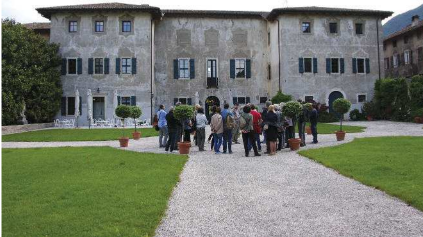
Visita guidata a Villa Bortolazzi Acquaviva, Trento (edizione 2010, "Ville e parchi") *