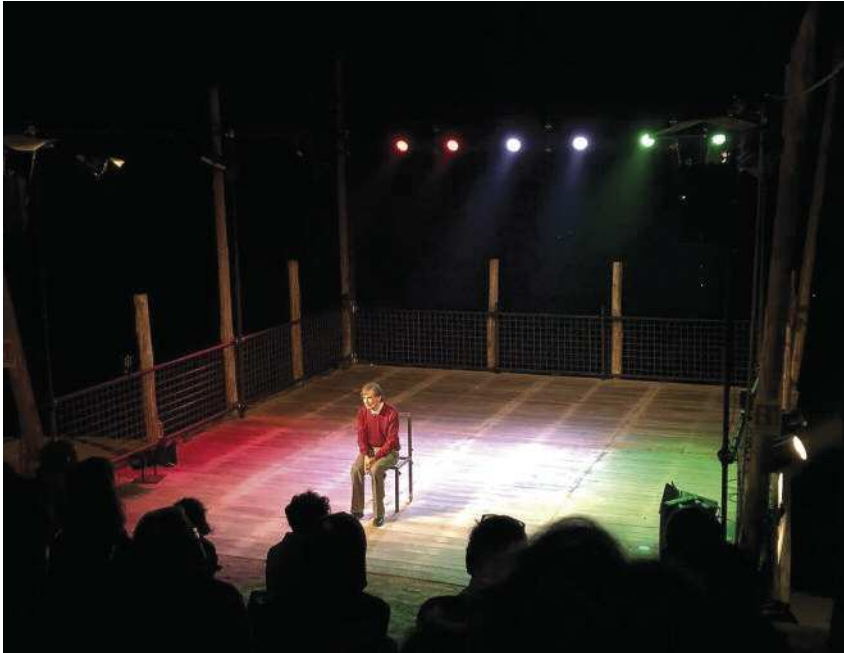
Teatro all'Aperto. Scene dal Festival Frontiere 2018.

resistenze (di cui la Fondazione si occupa con impegno), per mettere in scena l'importantissimo archivio storico della Fondazione e la storia stessa della borgata. Questo progetto di valorizzazione della borgata e di connessione della comunità con il luogo è una importante forma di narrazione che potrà essere presa ad esempio e replicata in altri territori montani.