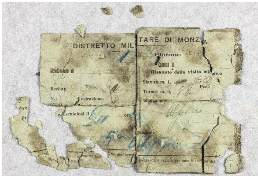
Fig. 4. Documento cartaceo che ha permesso il riconoscimento del soldato Beretta.