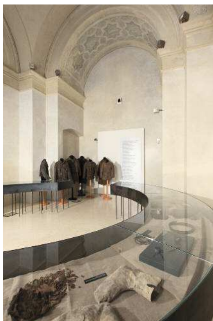
Fig. 2. Particolare dell'esposizione.