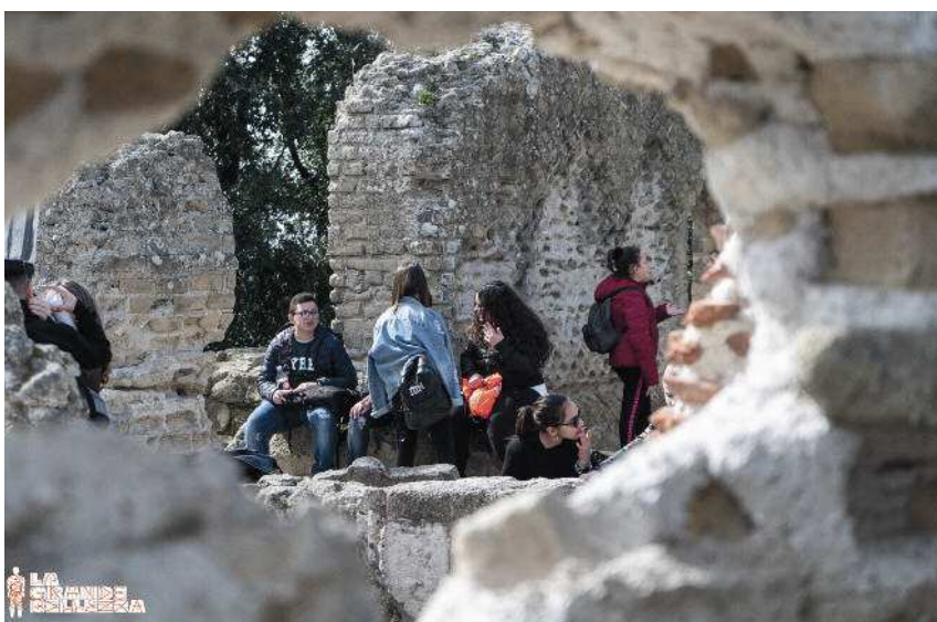
Scavi Cuma.

del patrimonio culturale immateriale, in particolare le ritualità collettive campane ; ricognizione e approfondimento dell'artigianato d'eccellenza: la sartoria ; antropologia teatrale come veicolo di auto narrazione.