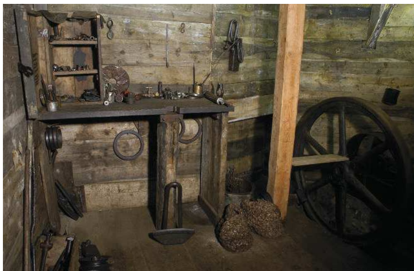
Fig. 10 Interno della stazione teleferica di Punta Linke (3629 m.s.l.m.) nel Gruppo Ortles-Cevedale, recuperata e resa visitabile.

L'archeologia riporta alla luce vite disciolte dalla Grande Storia (quella con la S maiuscola) e le restituisce alla memoria. Erano materia informe, brandelli di esistenze, resti di un'umanità devastata, reliquie moderne, corpi disturbanti di antichi nemici. Ma noi facciamo la storia (con la s minuscola) anche con i suoi scarti.