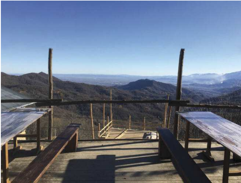
La Valle Stura.

creta adesione del progetto di architettura contemporanea ai principi fondamentali della conservazione e del restauro: quali la riconoscibilità, la reversibilità e il minimo intervento. Il metodo costruttivo lascia le tracce delle rovine come definizione dell'esistente e come lettura dei tessuti murari originali, trasformandole in contenitore ideale delle scatole di legno progettate. Queste, volute appositamente in legno di castagno, così da poterle costruire con materiali del luogo ed avere un bassissimo impatto ambientale, hanno struttura portante in ferro o in legno, e sono appoggiate su di una platea di fondazione in cemento armato. Le pareti, tutte dovutamente coibentate, formano dei pannelli costituiti da un doppio strato di legno con materiale isolante inserito internamente. Le coperture sono in lamiera, tranne dove si è reso ancora possibile l'utilizzo della vecchia copertura in lose. Le murature esistenti, in pietrame a vista, sono state rinforzate in modo da rimanere indipendenti dalla struttura in legno e consolidate mediante soffiatura e pulizia degli interstizi e iniezioni in profondità di malta di calce a granulometria finissima.