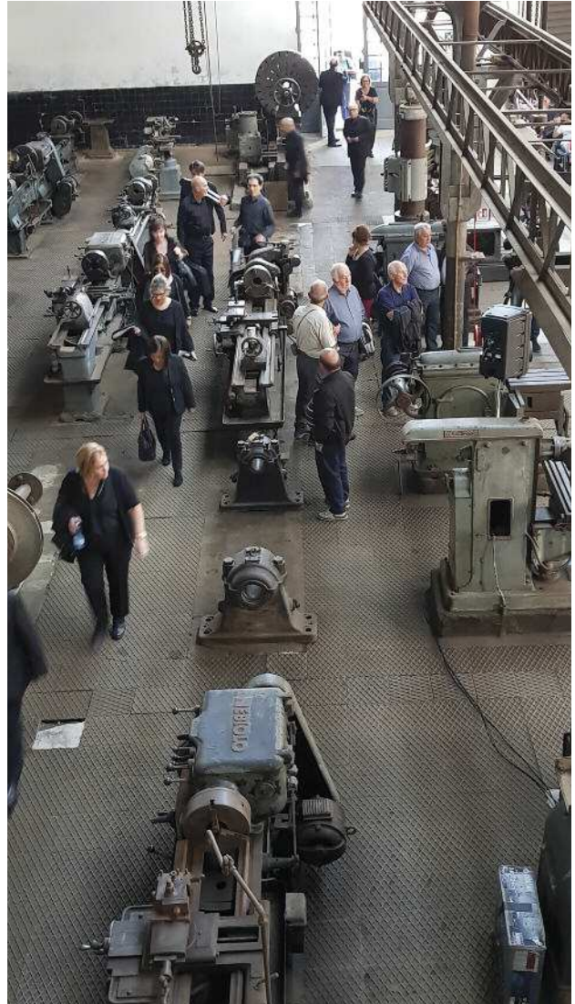
Foto dell'interno dopo gli interventi.

All'opera di tutela, protezione e valorizzazione del patrimonio di archeologia industriale si accompagnerà prossimamente l'installazione di una grande mostra permanente sulla STORIA DELL'EDUZIONE DELLE ACQUE NELLA MINIERA DI MONTEPONI che è stata ideata, progettata e realizzata da un Gruppo di Lavoro dell'Associazione Pozzo Sella comprendente i maggiori esperti del settore.