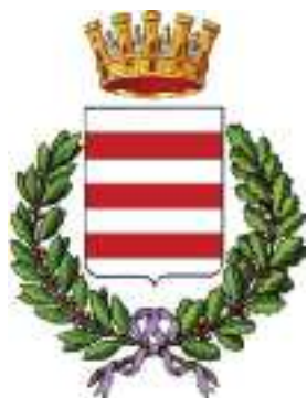
Comune di Ravello