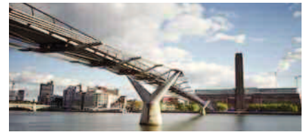
Tate Modern, Londra