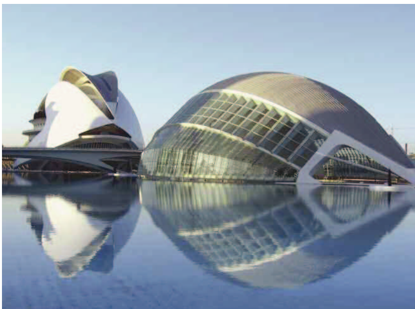
Città delle Arti e delle Scienze, Valencia