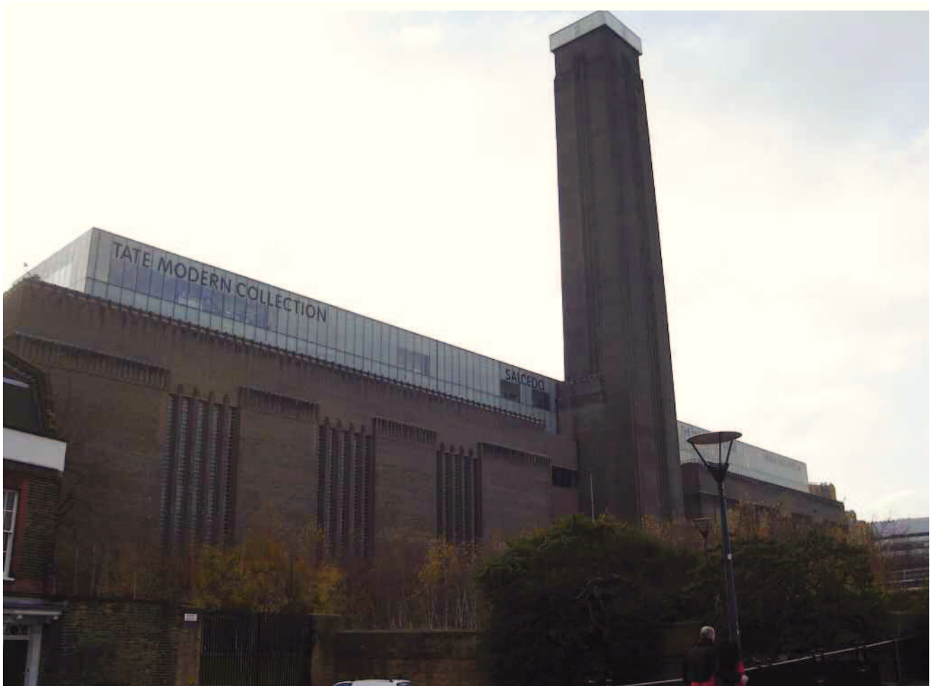
Tate Modern, Londra

Le prime esperienze di rigenerazione “culturale” risalgono agli anni Ottanta e sono contestuali all’affermazione della pianificazione strategica come strumento di governo del territorio e al processo di territorializzazione delle politiche di sviluppo che passano, proprio in questo periodo, da un approccio funzionale a uno territoriale, attribuendo sempre maggiore centralità alle risorse immateriali del territorio. Una tendenza, quest’ultima, che viene tuttavia a consolidarsi solo nei decenni successivi con l’affermarsi delle politiche di sviluppo knowledge based e culture-centered (Camagni, 1993). Ad una visione meramente patrimoniale della cultura che in-